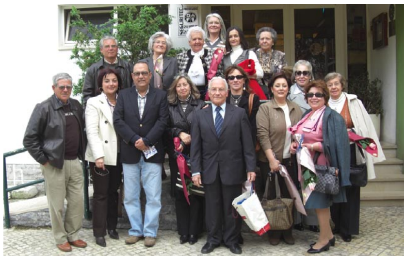
Corpo de voluntariado em almoço de convívio

Liga dos Amigos do Hospital de Santa Cruz Av. Prof. Reinaldo dos Santos 2799-523 Carnaxide Telef.: 21 043 31 49 Email: liga.amigoshsc@sapo.pt