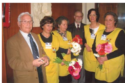
Voluntariado em comemoração do Dia do Doente

Várias foram as actividades que a Liga tem vindo a desenvolver, designadamente na área da qualidade e bem-estar